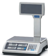
ER PLUS 4-Display

Die preisrechenenden Checkout-Lösungen von CAS verfügen über das eichfähige „Dialog-06“ Protokoll und separate Tara-Anzeigen.